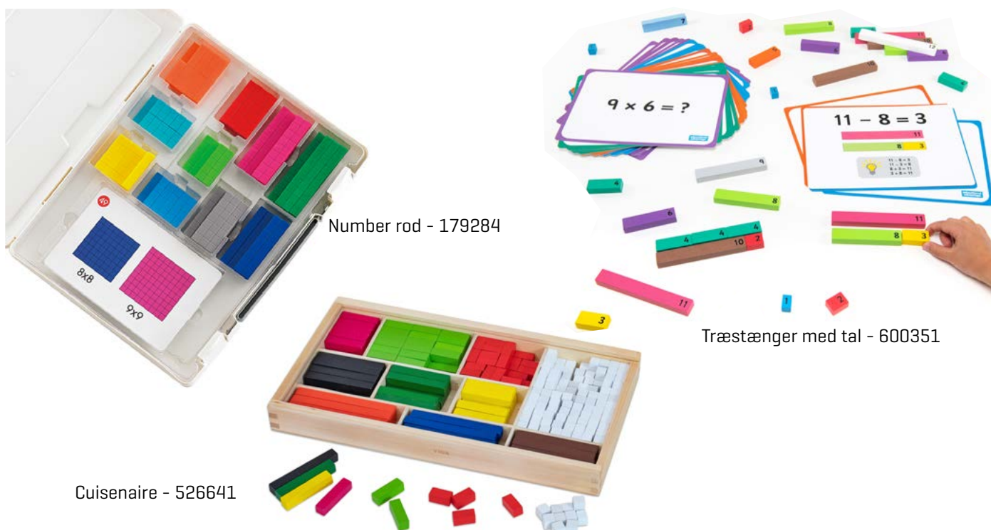
Number rod - 179284

Træstænger med tal - [600351] Alternativ: Cuisenaire [526641] / Number rod [179284]